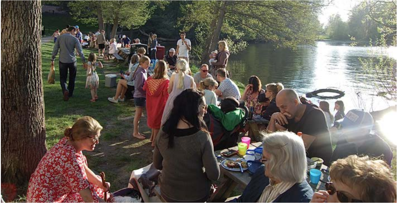
Festligt och fullsatt vid Badviken på Minnebergsdagen 2023.