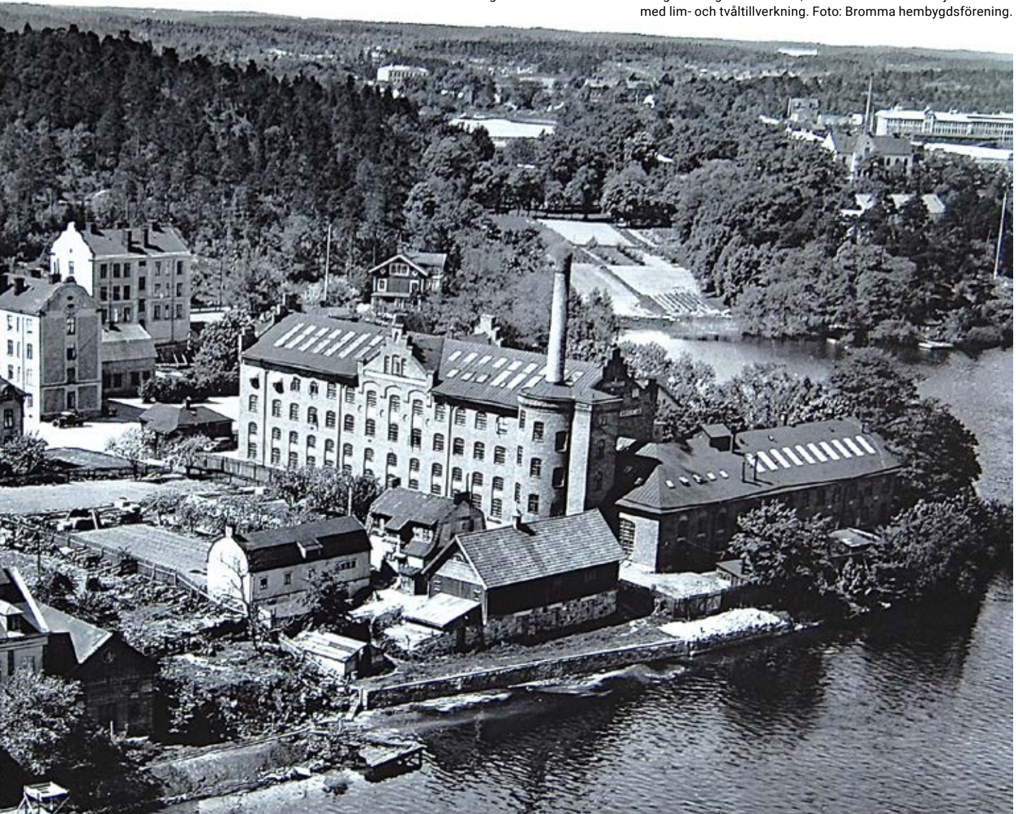
Minnebergs industriområde 1936: I bakgrunden gardinfabriken, fram till den stora benmjölsfabriken med lim- och tvålltillverkning.

vår industrihistoria. Då sprängdes stora skorstenen på benmjölsfabriken. Boende på Kungsholmen – länge kallad "Stankholmen" på grund av lukten från benmjölsfabrikens limtillverkning i Minneberg – hade dock kunnat andas ut redan 1965 då fabriken stängdes efter alla ilska protester mot den. Författaren Karl Rune Nordkvist flydde vid ett besök stanken från ruttnande djurben på den förgiftade marken i Minneberg för ett sundare liv i Hälsingland.