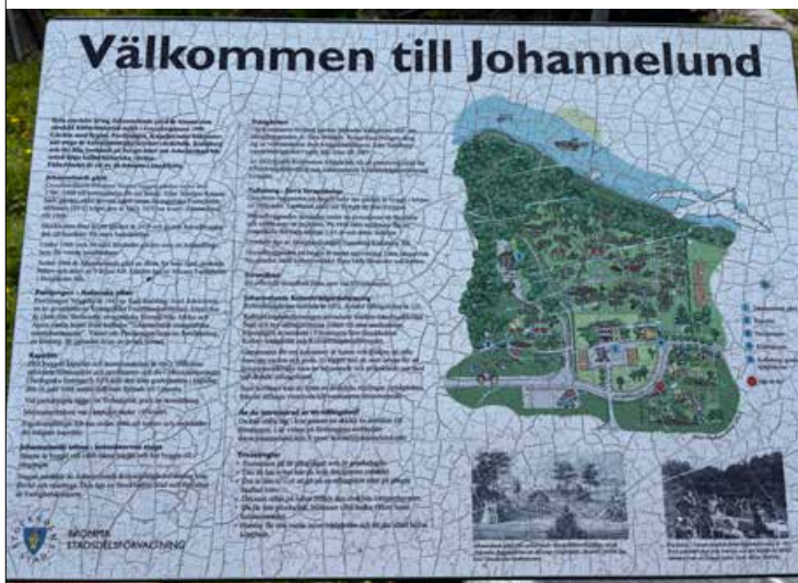
På den väderbitna skylten vid Johannelunds kolonilotter kan du läsa om husen, de historiska ekarna och kulturhistorien i området.