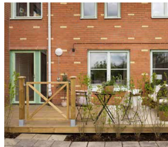
Uteplatsen på Svartviksslingan 73.

Ombyggnaden är samtidigt ett exempel på hur befintliga ytor kan utvecklas och användas på nya sätt för att skapa fler bostäder och stärka föreningens framtida ekonomi.