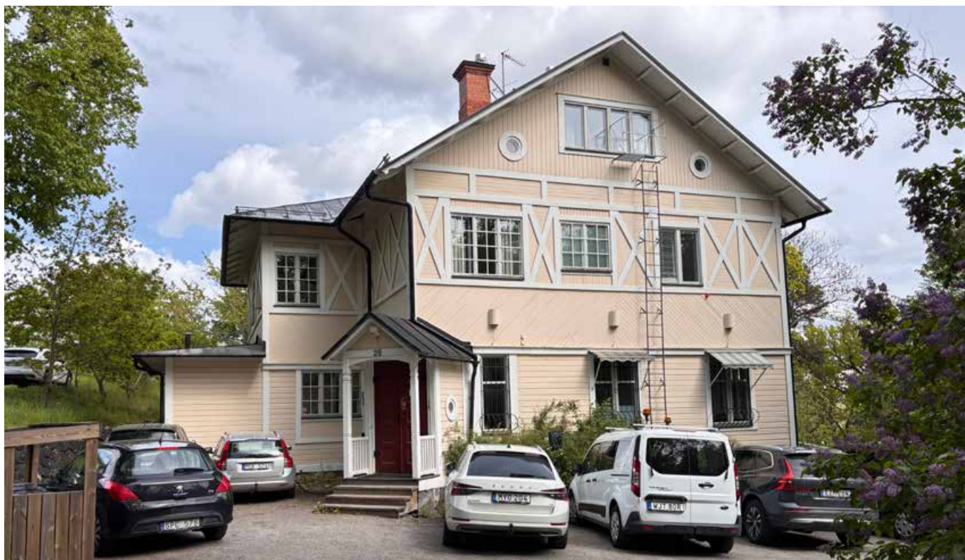
Sportfiskarnas huvudkontor ligger i Direktörsvillan på Svartviksslingan 28.