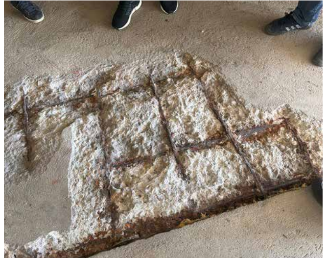
Bilden visar korroderad armering i betongplattan.