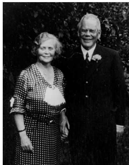
Paret Du Rietz.

Ullabritt visar gamla svartvita bilder, som de fått från Bromma hembygds-