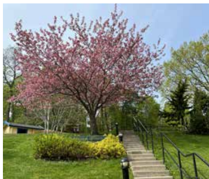
En av bilderna som kommer pryda våra tvättstugor.

finns att läsa på minneberg.se/foreningsstamma-tranan/ Om du vill ha ett utskrivet exemplar hör av dig till någon i styrelsen.