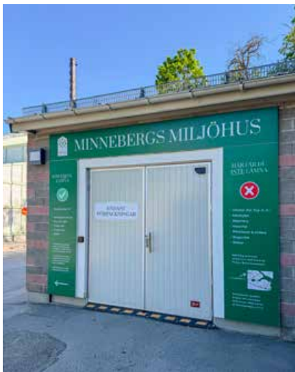
Nu är den nya skyltningen på plats på Miljöhuset.

Arbetet har kommit igång ordentligt, men det har visat sig att garage P1 var i sämre skick än P2 vilket kommer att innebära något mer omfattande arbeten än väntat. Vi inväntar för närvarande besked från entreprenören om den fortsatta tidplanen för projektet. I nuläget finns en mindre risk för att arbetet kan komma att försenas. Så snart vi har fått ett uppdaterat besked kommer vi att informera om detta via hemsidan och boendeappen.