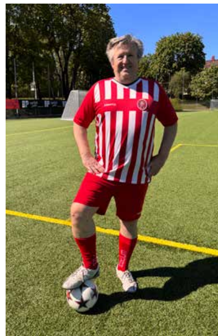
Zoran i ÄSKs klubbdräkt.

Men gärna fler damer, tycker både Anna och Lena.