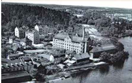
Minnebergs industriområde 1936:

När man promenerar genom Minneberg idag, mellan de terrasserade husen, de mjuka färgerna och utsikten över Ulvsundasjön, är det lätt att tro att området alltid sett ut så här. Men Minneberg är resultatet av en ovanligt genomtänkt idé – en vision om att skapa ett modernt bostadsområde som samtidigt bar med sig minnet av platsens historia.