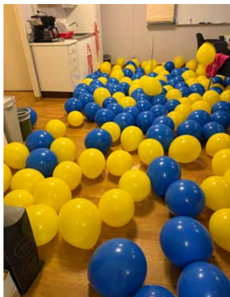
Ballongerna blåstes upp kvällen innan av arbetsgruppen i Svartviks styrelserum.

Det är alltid lika roligt när man ser alla glada miner under själva dagen och efteråt så är det väldigt trevligt att ta del av alla foton som tagits. Barnloppet drog över 200 deltagare och jag tyckte